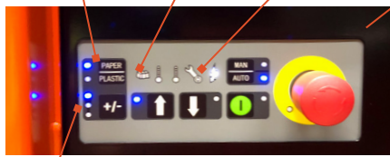
Tamaño de bala ajustable

Selector de material para cartón y plástico Indicador de servicio para cartón y plástico Indicador de servicio para plástico y bola completa