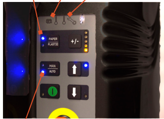
Tamaño de bala ajustable

Selector de material para cartón y plástico Indicador de bala completa Indicador de servicio