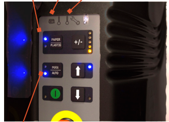
Tamaño de bala ajustable

Selector de material para cartón y plástico Indicador de bala completa Indicador de servicio